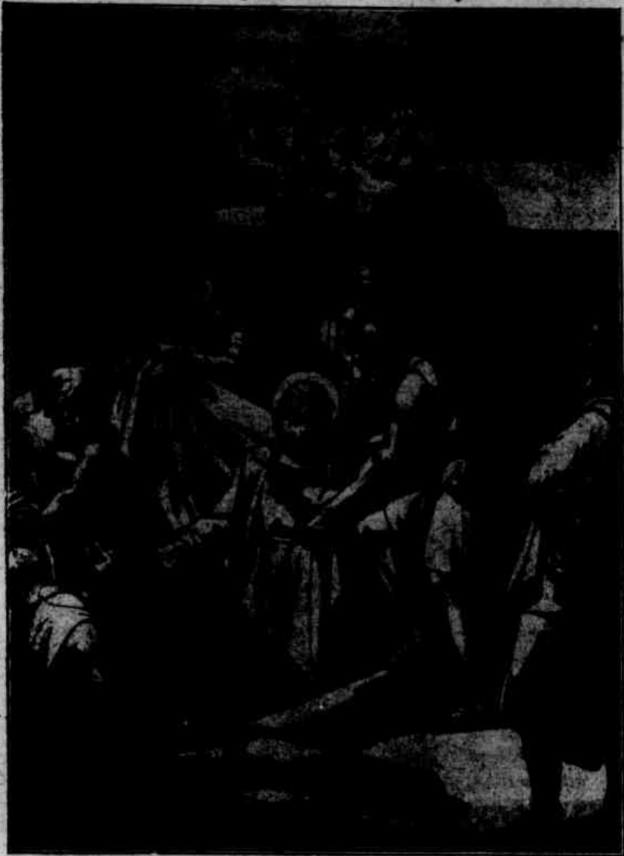
São Simeão é arrastado para a morte na cruz