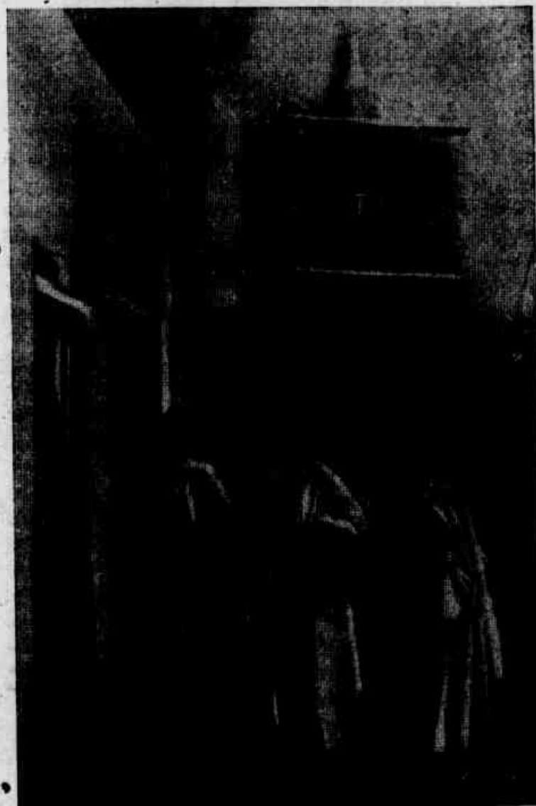
Missionários, os portadores da luz verdadeira: A Fé Católica