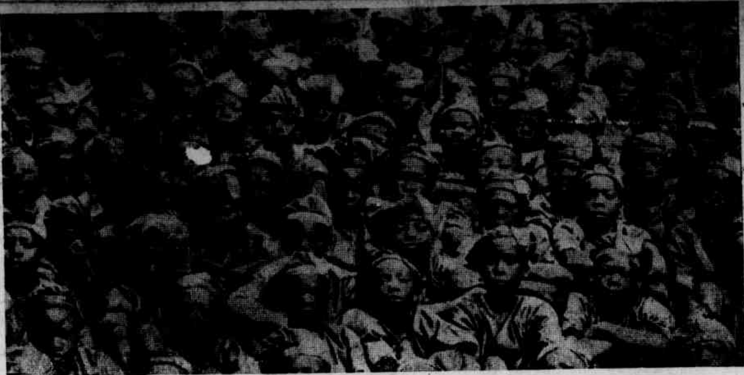
Numa aula de catecismo