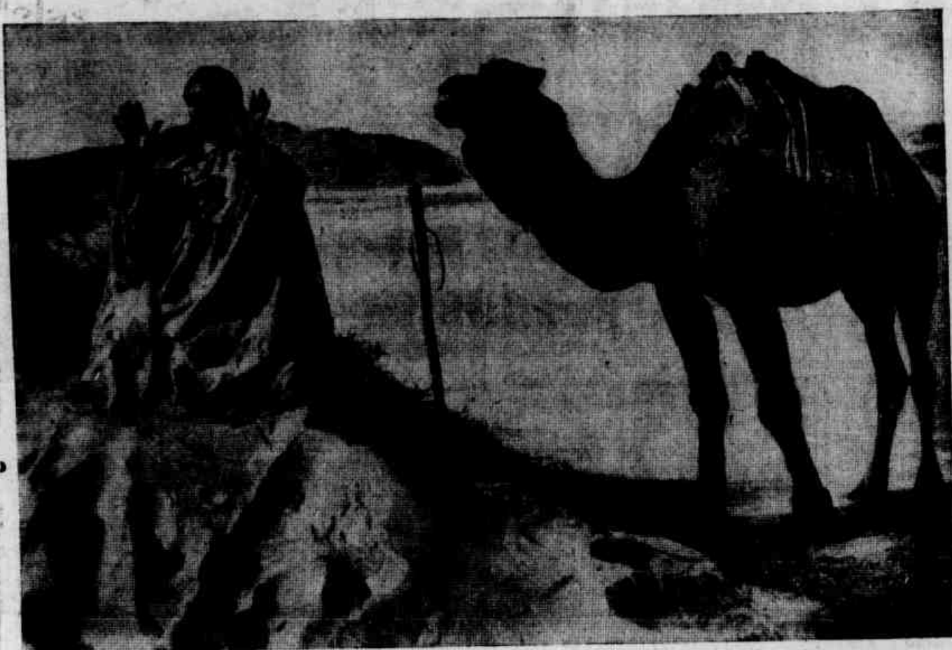
Senhor Onipotente, dai-me conhecer a luz da verdade!