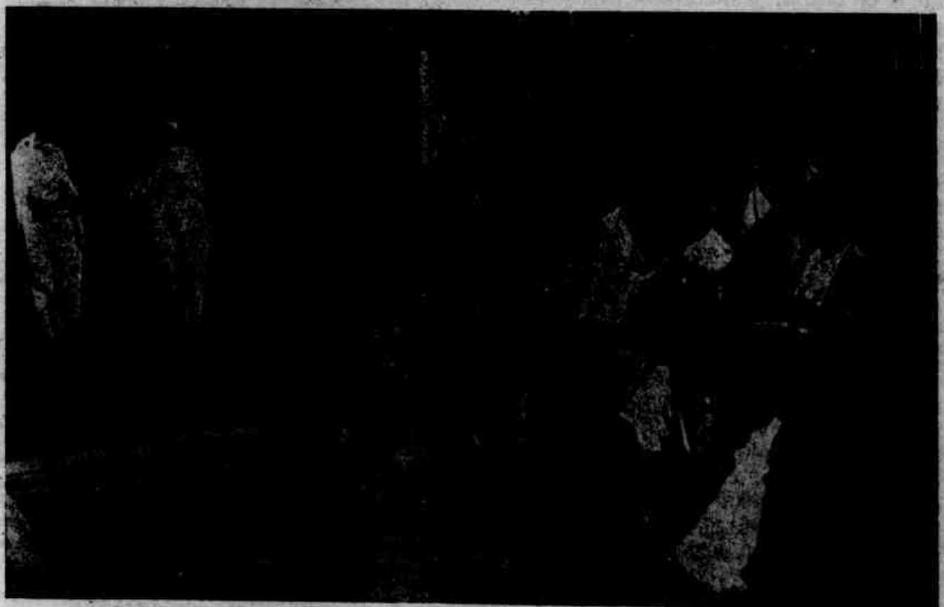
A Igreja do 1.º Século. Filhos de um martir cristão sendo recebidos por uma mãe cristã.

3. O Nome de Jesus: O Anjo que traz este nome do céu, explica-o também. Jesus significa “Salvador”; o Anjo disse de fato: “Pôr-lhe-às o nome de Salvador, por ele salvar o povo dos seus pecados”.