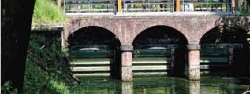
La Cascia Cassalese

Indirizzi utili: Per gli orari dei treni in servizio vedi: www.trenord.it FIAB (Federazione Italiana Amici della Bicicletta) del Cremasco, www.fabiabcremasco.it ARBI (Associazione per il Rilascio della Bicicletta) Via Monte Giove 2L, Bergamo www.fabiabcremasco.it FIAB BiciCicloturismo Cremona , Via Cesare Speciano 2, 0372-30066, www.fabiabcremasco.it Uffici turistici: Infopoint Bergamo, piazza Marconi (stazione FS), 035.210204, www.infopointbergo.net Infopoint Montebello , Via Allegretti 29, 0363.988336, www.bassobergamascaonline.it Pianura da Scoprire , piazzale Mazzini 2 c/o Bicistazione (stazione Treviglio Ovest), 0363.301452, www.pianuradascoprire.it Ufficio turistico Crema , p.zza Duomo 22, 0373.810020, www.protocollocrema.it