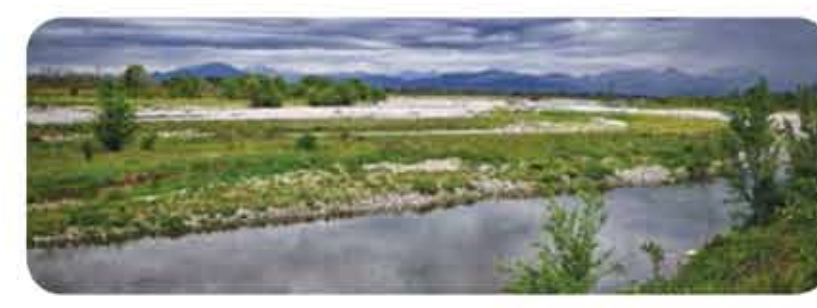
Il grido ciclabile del Serio con la strada della Praga

Lombardia, province di Bergamo e di Cremona. Itinerario ciclabile su pista ciclabile protetta (85%), qualche tratto su strada secondaria a uso promiscuo. Percorre la valle di pianura del fiume Serio, ora sull'una ora sull'altra sponda. Lunghezza: 57,9 km. Punto di partenza: stazione Fs di Seriate (Bg). Si raggiunge da Bergamo seguendo la Ciclovía dei Laghi nord in direzione Sarnico. Punto di arrivo: Cremona. Da cui si fa ritorno a Bergamo con la ferrovia per Treviglio. Centrale e corrispondenza per Bergamo dalla stazione Treviglio Ovest. Segnalazione: cannelli "Musica nel Vento". Storicità: itinerario in gran parte separato dalla viabilità ordinaria; qualche tratto dissestato; attenzione agli incroci con le strade vicinali. Pavimentazione: in gran parte su fondo sterrato o stabilizzato; su asfalto negli abitati e da Cassinetta a Cremona. Attrezzatura: pianeggiante. Mezzo: bicicletta da turismo con battistrada rinforzata, mountain-bike, gravel. Quando: sempre, salvo i giorni di gelo e in estate le ore calde della giornata. Noleggio bici: i servizi di noleggio bici sono inesistenti e la libertà del percorso, che non prevede ritorno allo stesso punto di partenza, consiglia di utilizzare la propria bici. Dove mangiare: a poca distanza dalla ciclovía, lungo le strade più trafficate e nei paesi si trovano ristoranti e trattorie. Meccanici e assistenza: ben distribuiti negli abitati in prossimità dell'itinerario, sono segnalati nelle pagine a seguire.