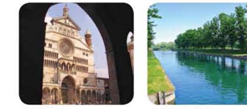
Il Duomo di Cremona

Lombardia, province di Bergamo, Lodi, Cremona, Milano. Itinerario ciclabile in parte su piste protette, in parte su strade secondarie a uso promiscuo. Percorre la valle di pianura del fiume Adda, lungo la sua sponda idrografica sinistra. Lunghezza: 105,3 km. Punto di partenza: stazione Fs di Cassano d'Adda (MI). Si raggiunge da Milano/Pesarete con la linea suburbana per Treviglio. Punto di arrivo: Cremona. Da cui si fa ritorno in treno a Milano. Segnalazione: pannelli segnalati "Musica nel Vento" e del Parco Adda Sud. Storicità: itinerario in parte separato dalla viabilità ordinaria; qualche tratto dissestato; attenzione agli incroci con le strade a traffico veicolare. Pavimentazione: in gran parte su fondo sterrato o stabilizzato; su asfalto negli abitati. Attrezzatura: pianeggiante. Mezzo: bicicletta da turismo con battistrada rinforzata, mountain-bike, gravel. Quando: sempre, salvo i giorni di gelo e in estate le ore calde della giornata. Noleggio bici: i servizi di noleggio bici sono inesistenti e la libertà del percorso, che non prevede ritorno allo stesso punto di partenza, consiglia di utilizzare la propria bici. Dove mangiare: a poca distanza dall'itinerario, lungo le strade più trafficate e nei paesi si trovano ristoranti e trattorie. Molte sono segnalate nelle pagine a seguire. Meccanici e assistenza: ben distribuiti negli abitati in prossimità dell'itinerario, sono segnalati nelle pagine a seguire.