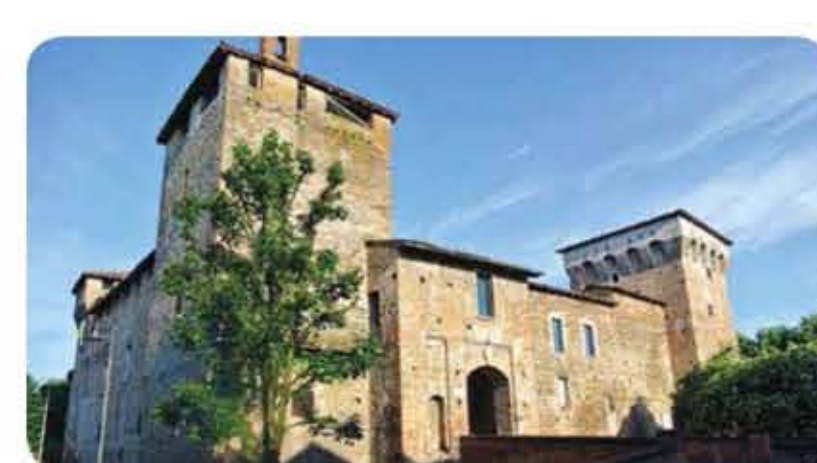
La Rocca di Romano in Lombardia

Indirizzi utili: Per gli orari dei treni in servizio vedi: www.trenord.it FIAB (Federazione Italiana Amici della Bicicletta) del Cremasco, www.fabiabcremasco.it ARBI (Associazione per il Rilascio della Bicicletta) Via Monte Giove 2L, Bergamo www.fabiabcremasco.it FIAB BiciCicloturismo Cremona , Via Cesare Speciano 2, 0372-30066, www.fabiabcremasco.it Uffici turistici: Infopoint Bergamo, piazza Marconi (stazione FS), 035.210204, www.infopointbergo.net Infopoint Montebello , Via Allegretti 29, 0363.988336, www.bassobergamascaonline.it Pianura da Scoprire , piazzale Mazzini 2 c/o Bicistazione (stazione Treviglio Ovest), 0363.301452, www.pianuradascoprire.it Ufficio turistico Crema , p.zza Duomo 22, 0373.810020, www.protocollocrema.it