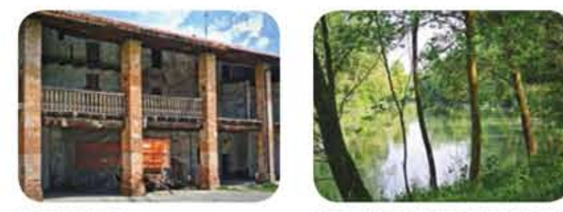
La Cascia Cassalese

Indirizzi utili: Per gli orari dei treni in servizio vedi: www.trenord.it FIAB (Federazione Italiana Amici della Bicicletta) del Cremasco, www.fabiabcremasco.it ARBI (Associazione per il Rilascio della Bicicletta) Via Monte Giove 2L, Bergamo www.fabiabcremasco.it FIAB BiciCicloturismo Cremona , Via Cesare Speciano 2, 0372-30066, www.fabiabcremasco.it Uffici turistici: Infopoint Bergamo, piazza Marconi (stazione FS), 035.210204, www.infopointbergo.net Infopoint Montebello , Via Allegretti 29, 0363.988336, www.bassobergamascaonline.it Pianura da Scoprire , piazzale Mazzini 2 c/o Bicistazione (stazione Treviglio Ovest), 0363.301452, www.pianuradascoprire.it Ufficio turistico Crema , p.zza Duomo 22, 0373.810020, www.protocollocrema.it